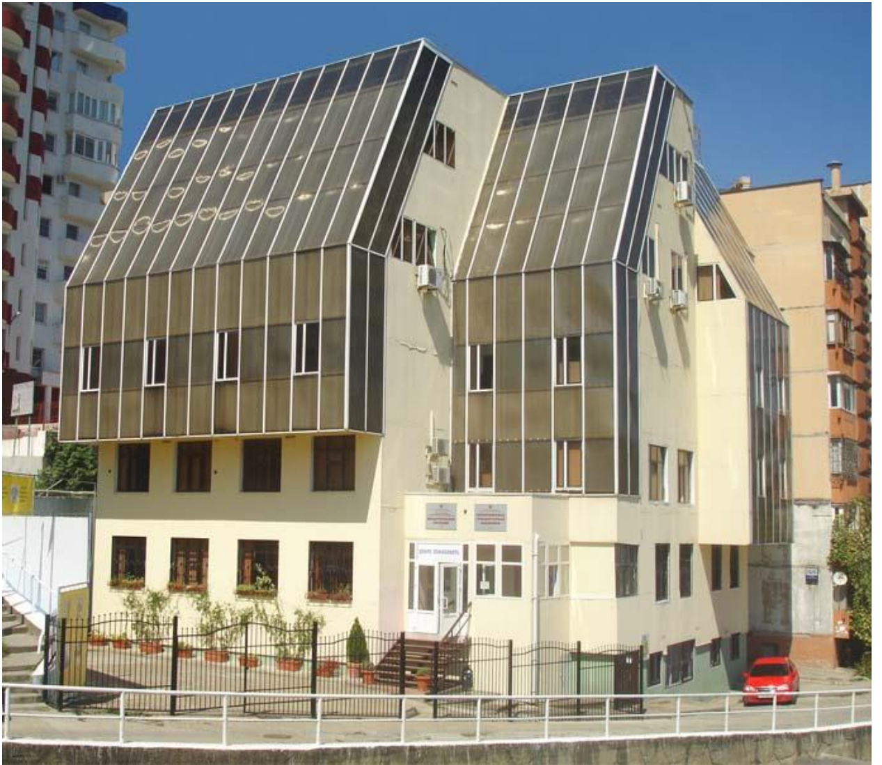
Корпус №2 (Академический колледж) — в Центральном районе г. Сочи на ул. Ландышевой, 12/4.